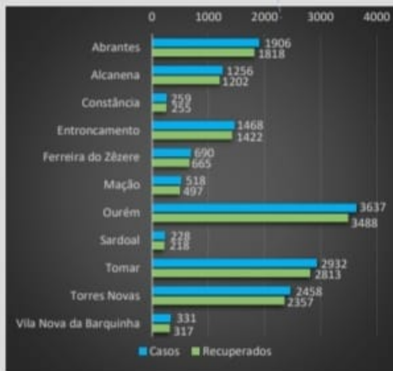
Figura - Distribuição dos Casos COVID19 pelos concelhos da área de influência do ACES MT