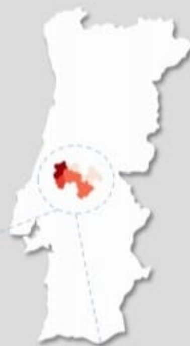
Quadro – Distribuição do número de casos COVID19 e número de óbitos para COVID19 pelos concelhos da área de influência do ACES MT