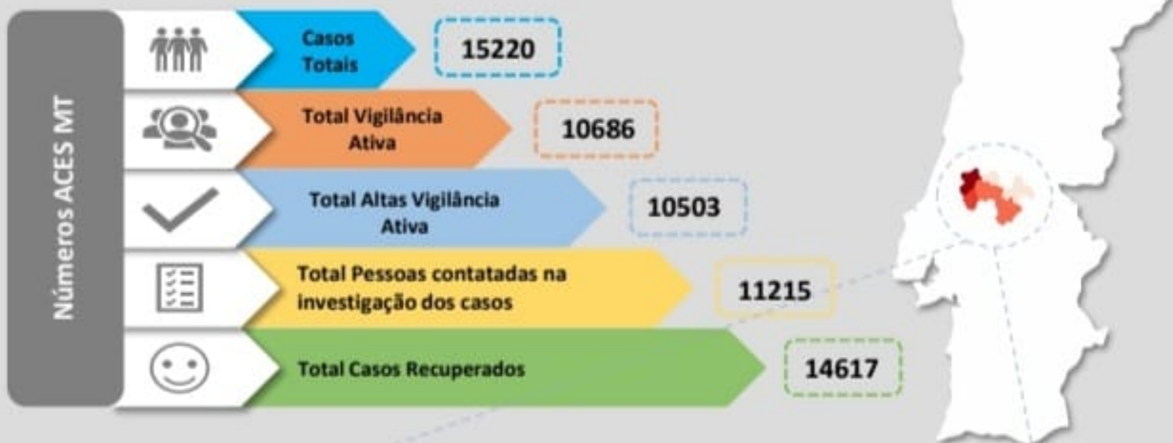
Quadro – Distribuição do número de casos COVID19 e número de pessoas em vigilância ativa para COVID19 pelos concelhos da área de influência do ACES MT