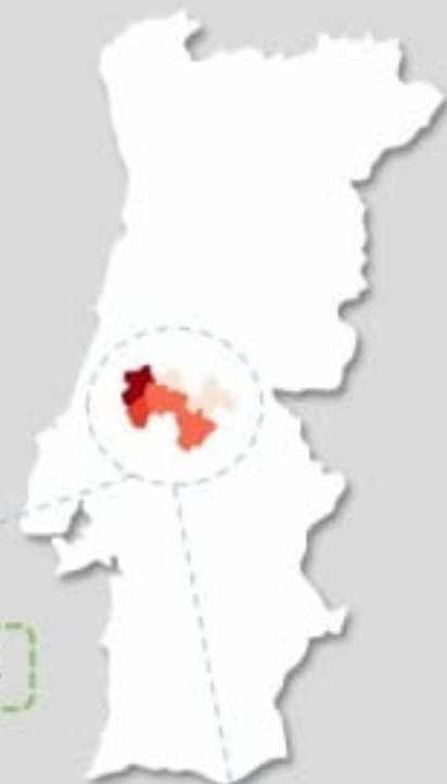
Quadro – Distribuição do número de casos COVID19 e número de pessoas em vigilância ativa para COVID19 pelos concelhos da área de influência do ACES MT