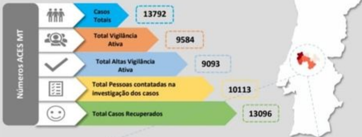
Quadro – Distribuição do número de casos COVID19 e número de pessoas em vigilância ativa para COVID19 pelos concelhos da área de influência do ACES MT