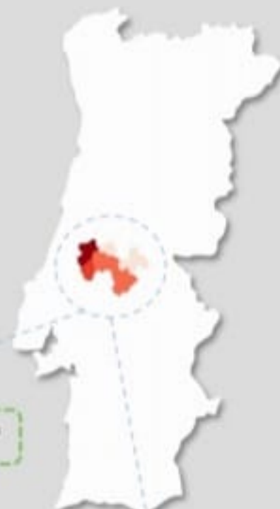
Quadro – Distribuição do número de casos COVID19 e número de pessoas em vigilância ativa para COVID19 pelos concelhos da área de influência do ACES MT