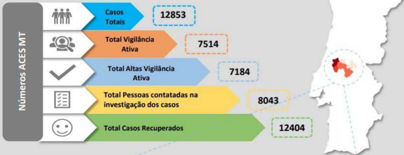
Quadro – Distribuição do número de casos COVID19 e número de pessoas em vigilância ativa para COVID19 pelos concelhos da área de influência do ACES MT