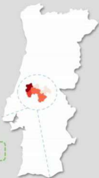
Quadro – Distribuição do número de casos COVID19 e número de pessoas em vigilância ativa para COVID19 pelos concelhos da área de influência do ACES MT