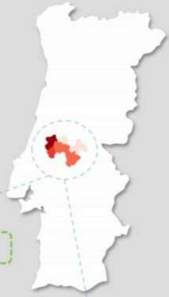
Quadro – Distribuição do número de casos COVID19 e número de pessoas em vigilância ativa para COVID19 pelos concelhos da área de influência do ACES MT