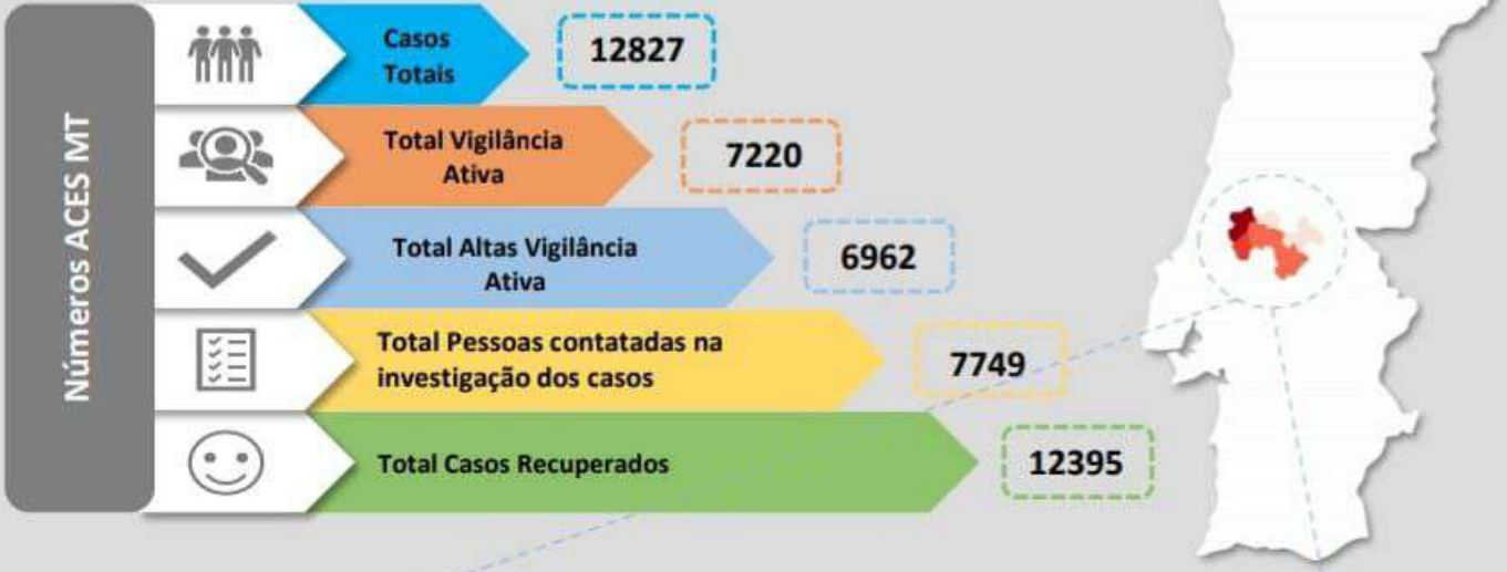
Quadro – Distribuição do número de casos COVID19 e número de pessoas em vigilância ativa para COVID19 pelos concelhos da área de influência do ACES MT