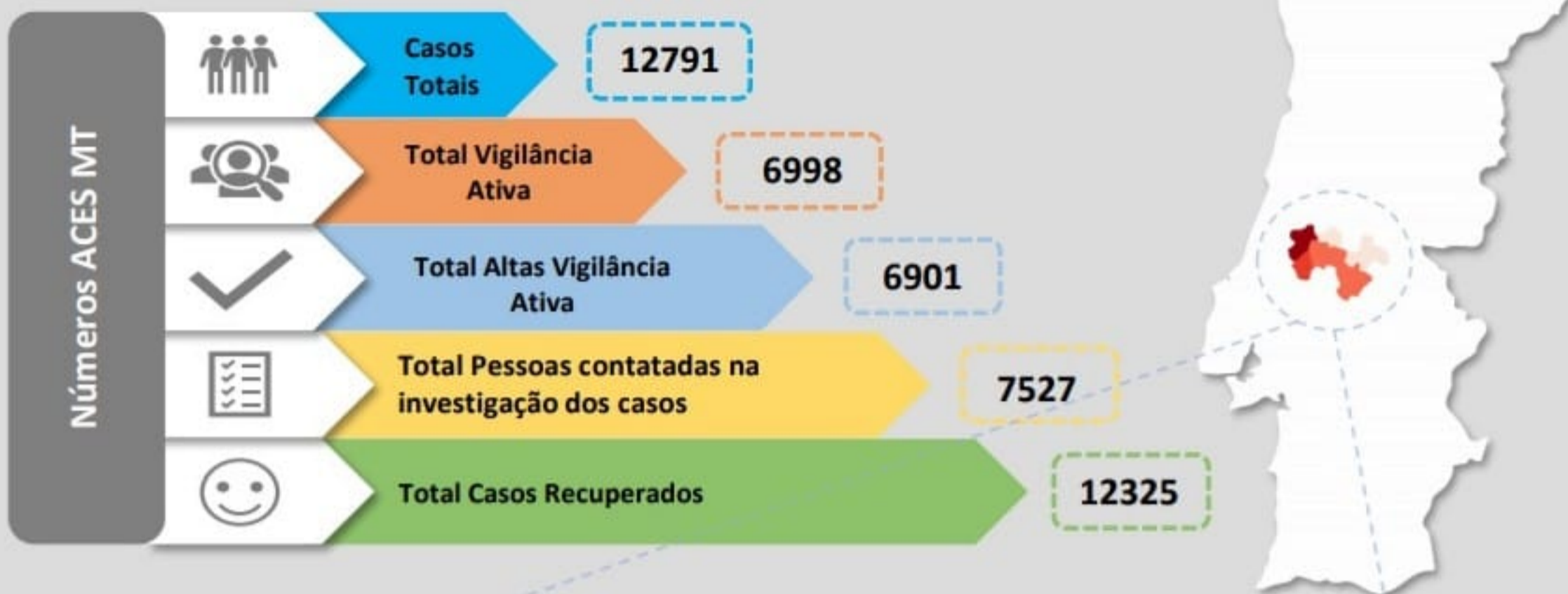
Quadro – Distribuição do número de casos COVID19 e número de pessoas em vigilância ativa para COVID19 pelos concelhos da área de influência do ACES MT