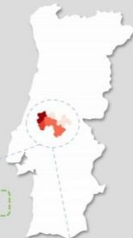
Quadro – Distribuição do número de casos COVID19 e número de pessoas em vigilância ativa para COVID19 pelos concelhos da área de influência do ACES MT