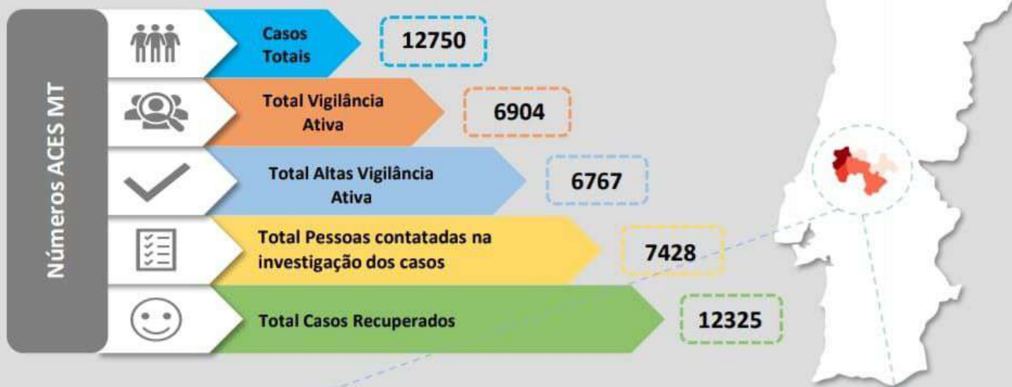
Quadro – Distribuição do número de casos COVID19 e número de pessoas em vigilância ativa para COVID19 pelos concelhos da área de influência do ACES MT