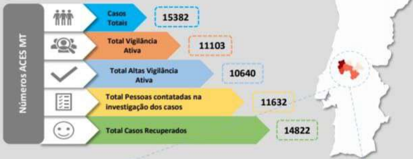
Quadro – Distribuição do número de casos COVID19 e número de pessoas em vigilância ativa para COVID19 pelos concelhos da área de influência do ACES MT