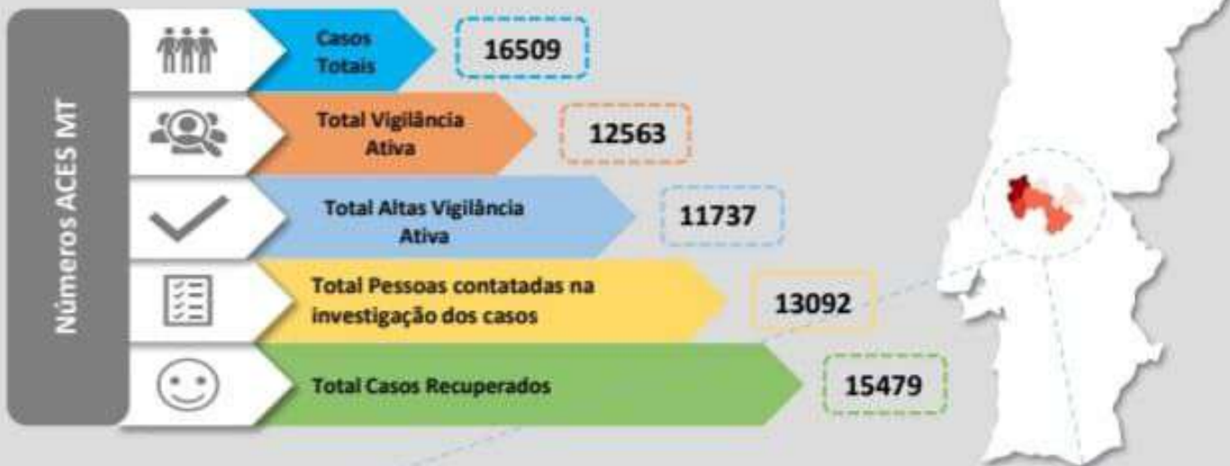
Quadro – Distribuição do número de casos COVID19 e número de pessoas em vigilância ativa para COVID19 pelos concelhos da área de influência do ACES MT