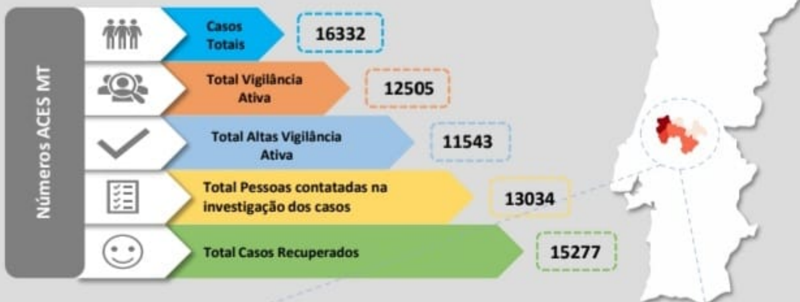
Quadro – Distribuição do número de casos COVID19 e número de pessoas em vigilância ativa para COVID19 pelos concelhos da área de influência do ACES MT