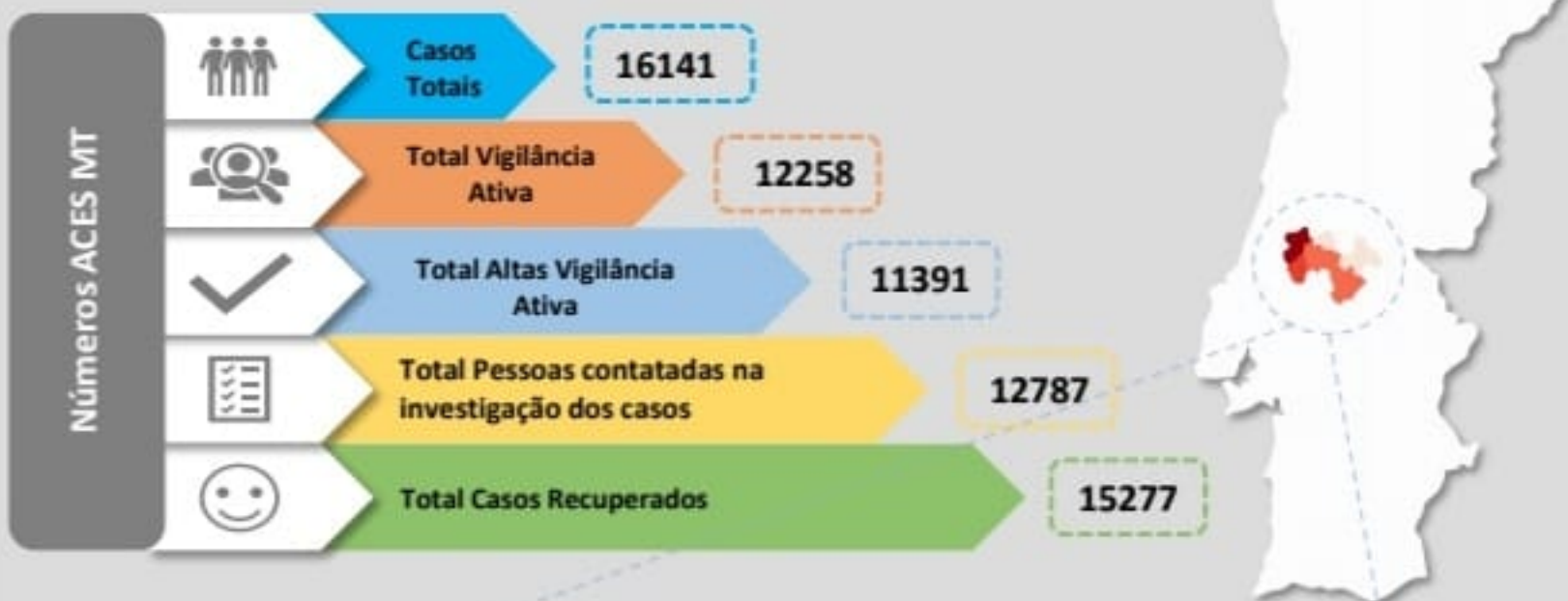
Quadro – Distribuição do número de casos COVID19 e número de pessoas em vigilância ativa para COVID19 pelos concelhos da área de influência do ACES MT