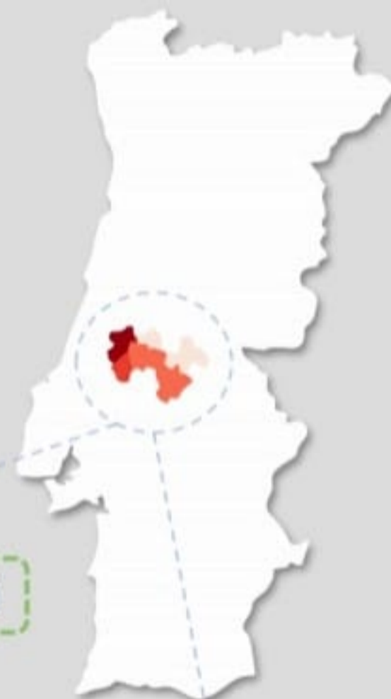
Quadro – Distribuição do número de casos COVID19 e número de pessoas em vigilância ativa para COVID19 pelos concelhos da área de influência do ACES MT