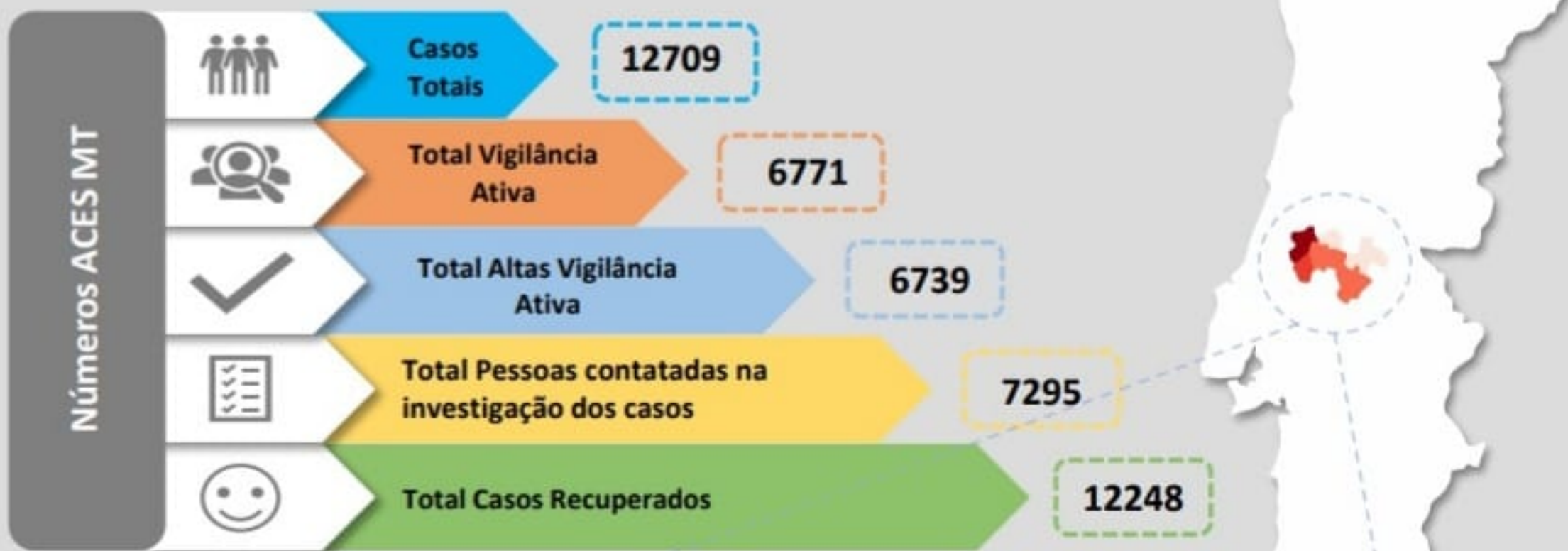
Quadro – Distribuição do número de casos COVID19 e número de pessoas em vigilância ativa para COVID19 pelos concelhos da área de influência do ACES MT