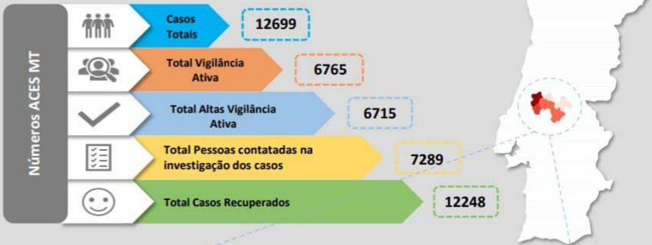
Quadro – Distribuição do número de casos COVID19 e número de pessoas em vigilância ativa para COVID19 pelos concelhos da área de influência do ACES MT