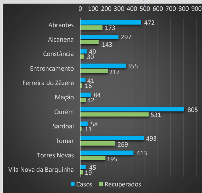
Figura - Distribuição dos Casos COVID19 pelos concelhos da área de influência do ACES MT