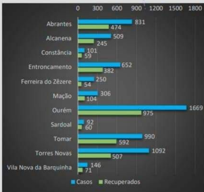
Figura - Distribuição dos Casos COVID19 pelos concelhos da área de influência do ACES MET