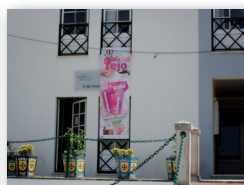
Município de Ferreira do Zêzere