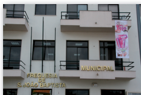
Município de Entroncamento

Quem passa, não fica indiferente e prende o olhar nos valores que se elevam e fazem girar todo o projecto: Vida, Inclusão e Solidariedade.