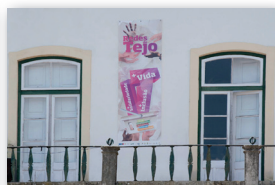
Município de Sardoal