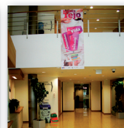
Município de Ourém